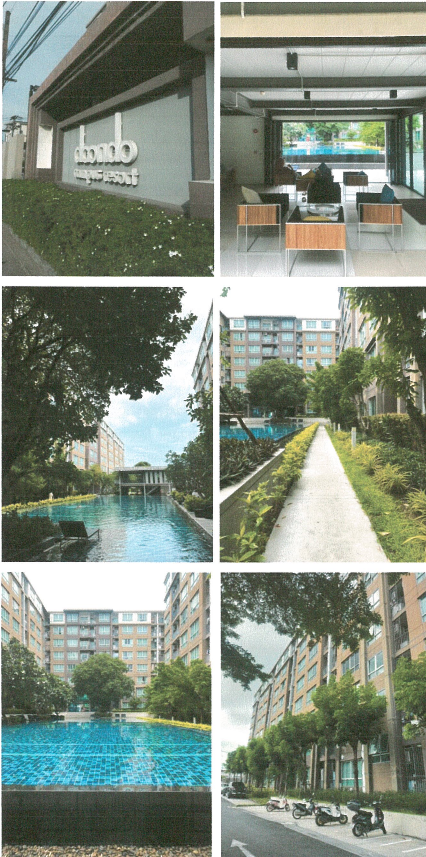
รูปที่ 1.4 การใช้พื้นที่อาคาร